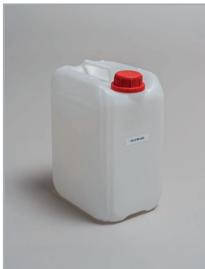
EK-5 IM (45)